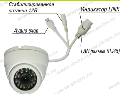
Рис. 1 Схема подключения